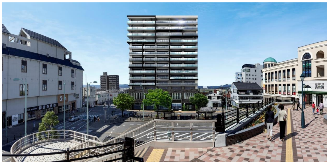
※中央の建物がポレスター長浜駅前 (完成予想図)

自社分譲マンション「ポレスター長浜駅前」(長浜駅北地区優良建築物等整備事業)の医療テナント用スペースとして 株式会社日本地域総合診療サポートと賃貸借契約を締結し、マンション居住者への医療連携サービス提供を推進。